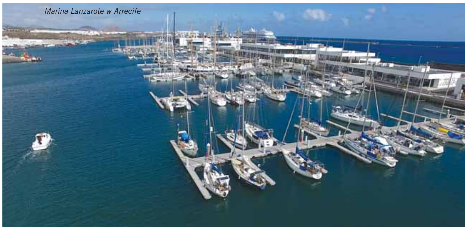
Marina Lanzarote w Arrecife

Wejście charakteryzuje średni stopień trudności. W dzień przy zachowaniu zasady „odhaczania” kolejnych boi jest raczej bezpro-