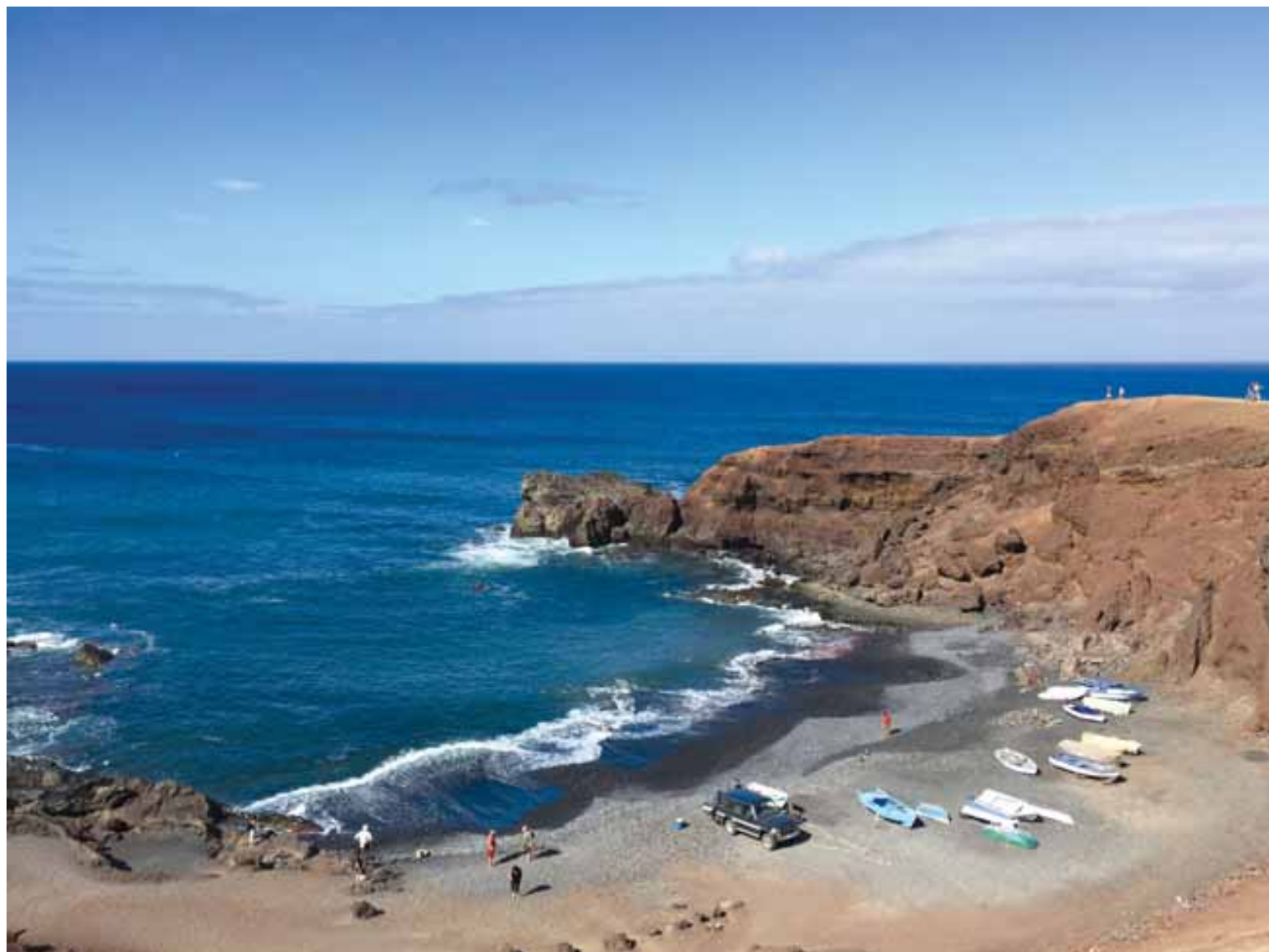
Kameralne małe zatoki to raj dla turystów

są na ruszcie ustawionym bezpośrednio nad gorącymi wulkanicznymi wyziewami. W północno-wschodniej części wyspy znajduje się Cueva de los Verdes – naturalny korytarz powstały w następstwie erupcji wulkanu. Do zwiedzania udostępniany jest kilometrowy odcinek jaskini. Wewnątrz panuje stała temperatura +19°C (wstęp wynosi 9 euro). Z uwagi na spore oddalenie atrakcji turystycznych od nielicznych portów wyspę najwygodniej jest zwiedzać samochodem (ceny wynajmu są nawet o połowę niższe niż na Gran Canarii i Teneryfie) lub autobusem. Warto wykupić karnet uprawniający do wstępu do głównych atrakcji turystycznych Lanzarote (dostępny w punktach informacji turystycznej; www.centrosturisticos.com ). Ze względu