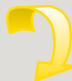
Kierunek ruchu lub sił oddziałujących na obiekt