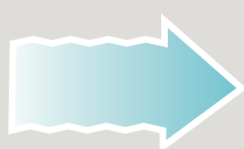
Pływ lub prąd